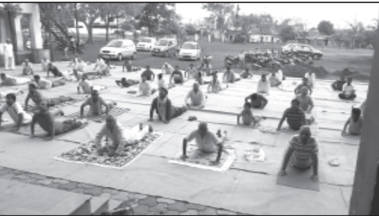
मालेगाव ना. ना. मुंदडा विद्यालयात योगा करताना

महाराष्ट्र कामगार कल्याण केंद्र वाशिमतर्फे दरवर्षी प्रमाणे यंदाही घेण्यात आलेल्या योग शिबिराला उत्स्फूर्त प्रतिसाद मिळाला अशी