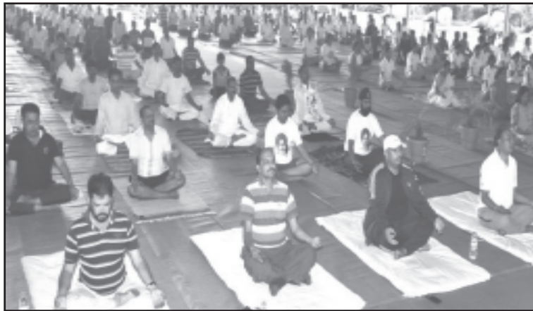
वाटाणे लॉनमध्ये योगा करताना अधिकारी, नागरिक

या कार्यक्रमात पतंजली योग समिती, आर्ट ऑफ लिव्हिंग,