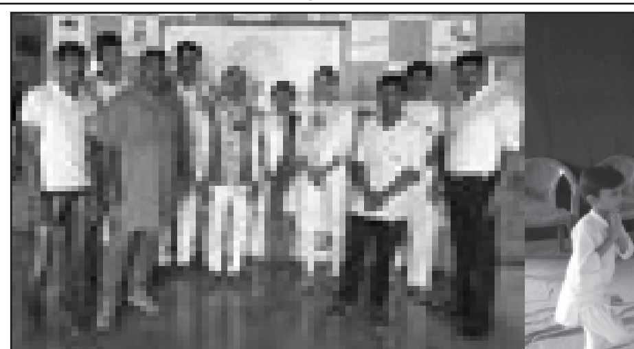
हॅम्पी फेसेस स्कूलमध्ये योगाचे धडे देताना योग प्रशिक्षक