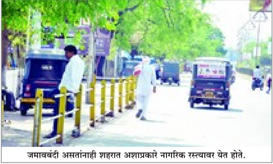
जमावबंदी असतानाही शहरात अशाप्रकारे नागरिक रस्त्यावर येत होते.

अमरावती, दि. २३ : नोव्हेल कोरोना या विषाणूजन्य आजाराचा सामना करण्यासाठी राज्य शासनाने जमावबंदी लागू केल्यानंतरही आज सोमवारी (ता. २३) अमरावतीकरांनी गर्दी केली होती. पेट्रोल पंप, बँका व रस्त्यावर नागरिकांचे वर्दळ सुरु होती.